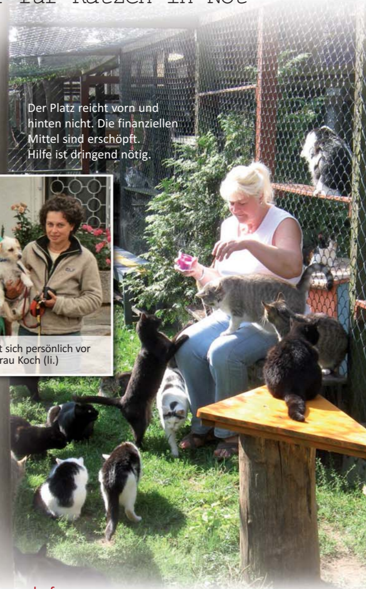
Der Platz reicht vorn und hinten nicht. Die finanziellen Mittel sind erschöpft. Hilfe ist dringend nötig.