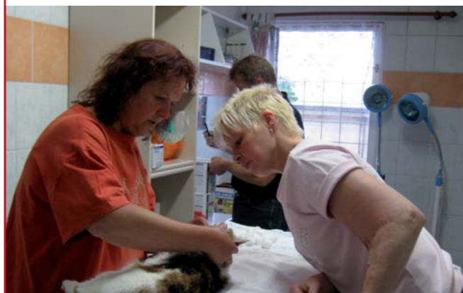
Kastration und Sterilisation – damit in Zukunft weniger Katzen in Not und Elend leben müssen.

Nur durch umfangreiche Kastrations- und Sterilisationsmaßnahmen ist es möglich, die unkontrollierte Vermehrung der Katzen nachhaltig zu verhindern.