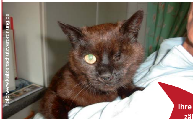
Wer tut so etwas? Immer wieder sind wir mit unvorstellbaren Grausamkeiten an Katzen konfrontiert.

Wir folgen jedem Hinweis auf Tierquälerei, wie auch das Aussetzen, Erschlagen oder Ertränken von Katzen. Wir bitten alle Tierfreunde, nicht wegzusehen und uns, die Polizei das Veterinäramt oder einen Tierschutzverband anzurufen, wenn sie den Verdacht auf Tierquälerei haben.