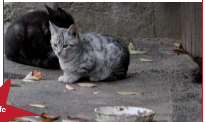
Futterstellen für freilebende Katzen – eine wichtige Hilfe, damit die Tiere wenigstens eine regelmäßige Mahlzeit am Tag bekommen.

Mit ihrer Spende helfen Sie nicht nur den Katzen auf dem Sternenhof und der Arche. Ein Teil der Spendengelder kommt der Katzenhilfe Hoyerswerda zugute, die dringend auf Unterstützung angewiesen ist. Helfen Sie darüber hinaus, indem Sie Futterstellen für Streuner einrichten.